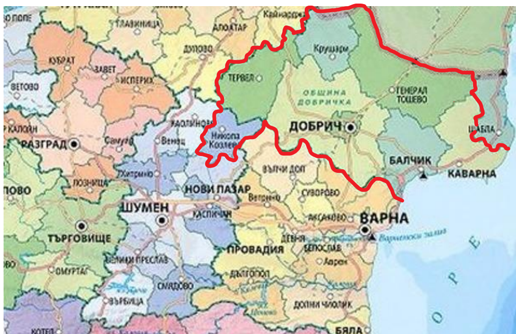
Карта 1. Общини-участници в РСУО – регион Добрич